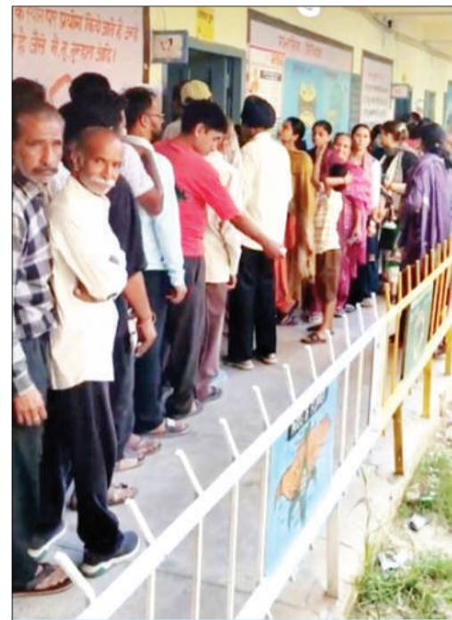
मतदान के लिए लाइनों में खड़े लोग