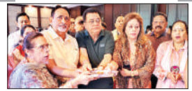
पेज 06 विदेशी धरती वाली में गुंजा धुव मक्ति का सदेश...