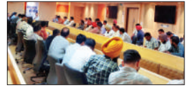
पेज 12 चंडीगढ़ में अतिक्रमण और गंदगी पर नगर निगम...