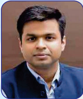
Sh. Himanshu Jain (IAS) Deputy Commissioner