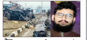
पेज 08 पुनवामा हमले का मास्टरमाइंड हमजा पुरदान पीओके में.....