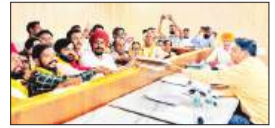
पेज 12 डेराबस्सी, लालडू और जीरकपुर में 'आप' का...