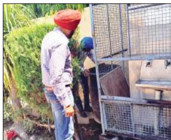
डेंगू के लारवा की जांच करते हुए स्वास्थ्य विभाग की टीम

जिले में डेंगू की अब तक कितने मरीज सामने आए हैं मरीजों की अस्पतालों की रिपोर्ट में क्या बताया गया क्या मरीज पॉजिटिव था अथवा नेगेटिव यह कभी नहीं बताया जाता बस क्रॉस चेकिंग के नाम पर अधिकतर मरीजों को स्वास्थ्य विभाग