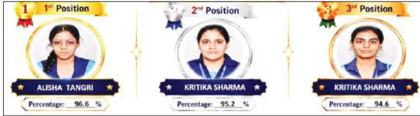
बीवीएम सीनियर सैकेंडरी स्कूल उधम सिंह नगर के टॉपर्स

इससे उनका साल खराब नहीं होगा और वे अपने अंक सुधार सकेगे। बोर्ड जल्द ही