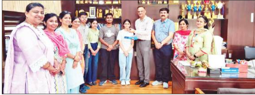
बीवीएम स्कूल उधम सिंह नगर के स्टाफ ने बच्चों का मुंह कराया मिट्टा

वहीं, परसेंटेज के हिसाब से देखें तो लुधियाना रीजन में कुल 87.92% स्टूडेंट पास हुए हैं। इनमें 85.76% लड़के और 90.24% प्रतिशत लड़कियां शामिल हैं। इस हिसाब से लड़कों की तुलना में करीब 5% ज्यादा लड़कियां पास हुई हैं। वहीं, लुधियाना रीजन में 9977 स्टूडेंट्स की कंपार्टमेंट आई है। वहीं एक या अधिक विषयों में पास न होने वाले छात्रों को इस बार भी कंपार्टमेंट परीक्षा का मौका मिलेगा।