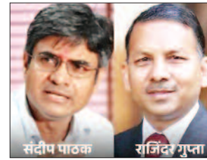
संदीप पाठक राजिंदर गुप्ता

लुधियाना/यूटर्न/8 मई। पंजाब एवं हरियाणा हाईकोर्ट ने आम आदमी पार्टी छोड़कर भाजपा में शामिल हुए राज्यसभा सांसद संदीप पाठक को राहत मिली है। हाईकोर्ट ने सोमवार तक उन पर एक्शन लेने पर रोक लगा दी। इसमें पंजाब सरकार को नोटिस