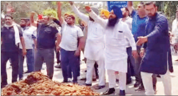
निगम ऑफिस बाहर फेंका गया गोबर