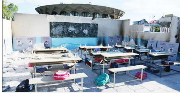
आईआरएनए के मुताबिक, शिक्षा मंत्री ने बताया कि करीब 20 स्कूल पूरी तरह नष्ट हो गए थे, जबकि सबसे अधिक नुकसान तेहरान, केर्मानशाह, इस्फहान

अमेरिका-इजरायल एयर स्ट्राइक के बाद 40 दिन तक चले संघर्ष में ईरान की कई इमारतों और बुनियादी ढांचों को नुकसान पहुंचा। कई शैक्षिक संस्थान तबाह हो गए। इस बीच ईरान में शिक्षा व्यवस्था को बहाल करने की कोशिशें तेज हो गई हैं। शिक्षा मंत्री अलीरजा काजेमी ने कहा है कि संघर्ष के दौरान क्षतिग्रस्त हुए 1,300 स्कूलों में से 775 की मरम्मत अब तक पूरी कर ली गई है। ईरानी न्यूज एजेंसी