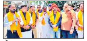
पेज 06 बाबा साहिब को समर्पित विशाल पैदल मार्ग...