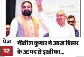
पेज 12 नीतीश कुमार ने आज बिहार के उद पद से इस्तीफा...