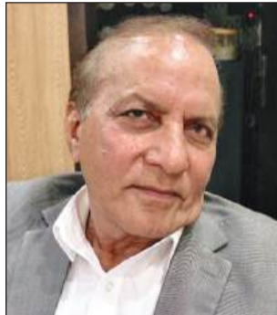
पूर्व अकाली विधायक अकाली कलेर

जगरावा/यूटर्न/2/मार्च।स्थानीय बीडीपीओ (BDPO) कार्यालय में ब्लॉक समिति के चेयरमैन और वाइस चेयरमैन के चुनाव को लेकर सोमवार को जमकर सियासी झुमा देखने को मिला। कोरम अधूरा होने और कानूनी प्रक्रिया पूरी न होने का हवाला देकर प्रशासन ने ऐन मौके पर चुनाव स्थगित कर दिया। इसके बाद बीडीपीओ दफ्तर पूरी तरह से 'सियासी अखाड़े' में तब्दील हो गया। विपक्ष (कांग्रेस और शिरोमणि अकाली दल) ने सत्ताधारी आम आदमी पार्टी (AAP) पर हार के डर से चुनाव टालने का गंभीर आरोप लगाया है। वहीं, बहसबाजी के बीच एक अधिकारी के रिश्तेदार की मौत पर की गई कथित विवादित टिप्पणी ने इस पूरे मामले में आग में घी डालने का काम किया है। कांग्रेस के 13 और अकाली दल के 4 सदस्य मौके पर डटे रहे, जबकि आम आदमी पार्टी (AAP) के 8 सदस्यों में से एक भी चेहरे ने दफ्तर में एंट्री नहीं की। प्रशासन के मुताबिक, कई सदस्यों ने अभी तक पद की शपथ ही नहीं ली थी, जो कि किसी भी चुनाव में हिस्सा लेने के लिए कानूनी रूप से अनिवार्य है। बताया गया कि दफ्तर के एक कर्मचारी के ससुर का अचानक निधन हो गया था, जिसके चलते वीकेड (शनिवार-रविवार) के कारण कुछ सदस्यों तक चुनाव की आधिकारिक सूचना (नोटिस) नहीं पहुंच सका।