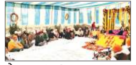
पेज 06 तू ही तू में प्रारम्भ हुआ थी गुरु ग्रंथ साहब जी...