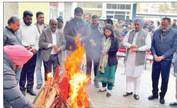
नगर निगम बटिंडा परिसर में लोहड़ी और माघी के पावन अवसर पर भव्य कार्यक्रम का आयोजन किया गया।

‘अपना घर’ में उम्मीद की लोहड़ी: कैंसर से जूझ रहे मरीजों के संग इंटास फाउंडेशन ने बांटी मुस्कानें