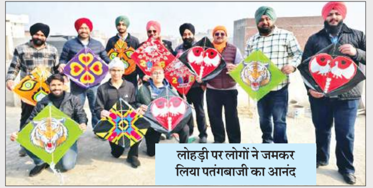
लोहड़ी पर लोगों ने जमकर लिया पतंगबाजी का आनंद

VOL: 11 | ISSUE 03 | WEDNESDAY 14-01-2026 | RS 3 | PAGE-8 | PUBLISHED BY: LUDHIANA | HINDI DAILY NEWSPAPER Visit at : www.uturntime.com