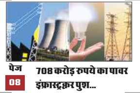
पेज 08 708 करोड़ रुपये का पावर इंफ्रास्ट्रक्चर पुश...