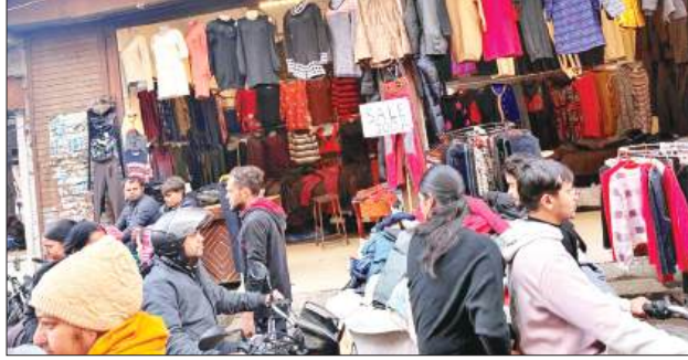
सड़कोप र दुकानदारों के कब्जे बरकरार