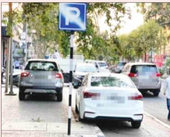
वॉकिंग स्ट्रीट पर लोगों के चलने को बनाए फुटपाथ पर खड़ते हैं वाहन