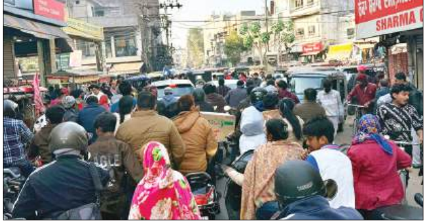
सुभानी बिलिंग रोड पर जाम में फंसे लोग