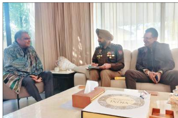
मंत्री संजीव अरोड़ा और एसीपी गुरदेव सिंह ने की मीटिंग

राजदीप सिंह सैनी लुधियाना/यूटर्न/11 जनवरी। लुधियाना में अगर आप भी ट्रैफिक नियम तोड़ रहे हैं तो सावधान हो जाइए, क्योंकि अब नियम तोड़ने पर सिफारिश नहीं चलेगी, बल्कि सीधा चालान होगा। यह एक्शन प्लान जल्द शहर में लागू होने जा रहा है। रविवार को शहर की ट्रैफिक समस्याओं संबंधी कैबिनेट मिनिस्टर संजीव अरोड़ा की और से ट्रैफिक एक्सपर्ट एसीपी ट्रैफिक गुरदेव सिंह के साथ मीटिंग की गई। इस दौरान मंत्री अरोड़ा की और से एसीपी गुरदेव सिंह के साथ मिलकर शहर को ट्रैफिक जाम से निजात दिलाने और लोगों को रूल्स फॉलो कराने के प्लान पर गंभीरता से चर्चा की। मीटिंग में कई अहम फैसले लिए गए। अब 25 प्वाइंट्स के तहत शहर में ट्रैफिक सुधार किया जाएगा। इस दौरान मंत्री संजीव अरोड़ा की और एसीपी ट्रैफिक गुरदेव सिंह को स्पेशल पावर्स दी गई हैं, ताकि वह अपना काम खुलकर, निष्पक्षता और बिना किसी दबाव के कर सकें। इस संबंधी एसीपी द्वारा मंत्री अरोड़ा को रिपोर्ट की जाएगी। एसीपी गुरदेव सिंह अनुसार मंत्री संजीव अरोड़ा का सपना है कि ट्रैफिक मामले में लुधियाना को चंडीगढ़ बनाने की तर्ज पर बनाना है। जिसके लिए काम शुरू किया जा रहा है। जल्द ट्रैफिक सुधार का असर देखने को मिलेगा।