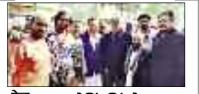
पेज 06 गुरु गोबिंद सिंह के प्रकाश पर्व पर मनीमाजरा...