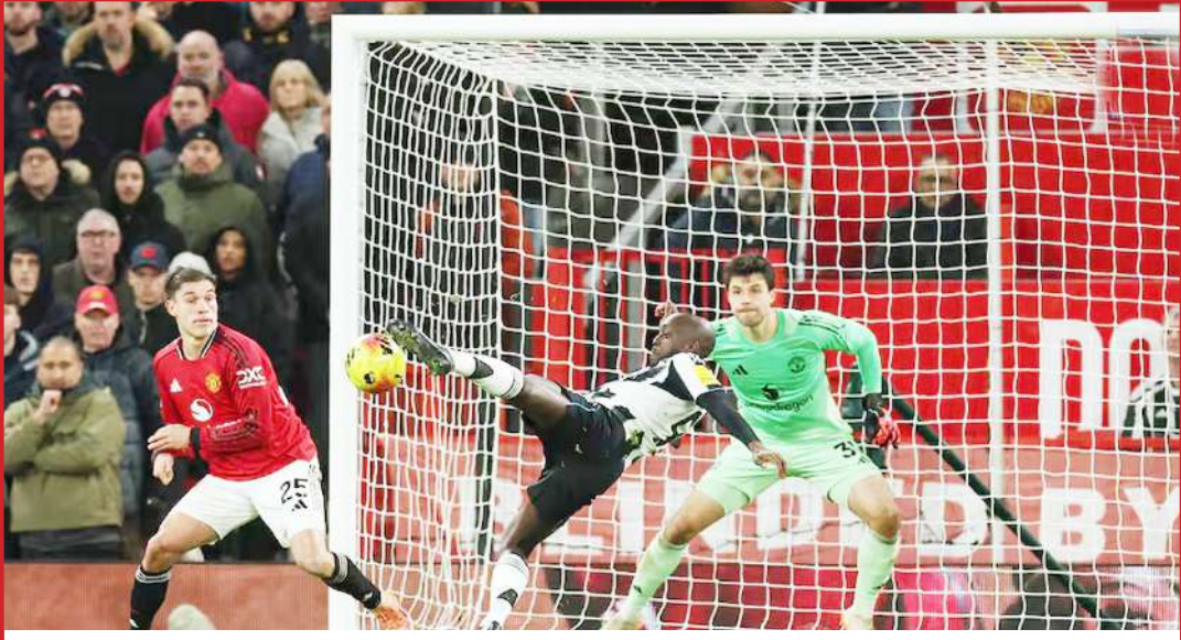
मैनचेस्टर में प्रीमियर लीग फुटबॉल में खेलते हुए मैनचेस्टर यूनाइटेड और न्यूकास्टल के खिलाड़ी।