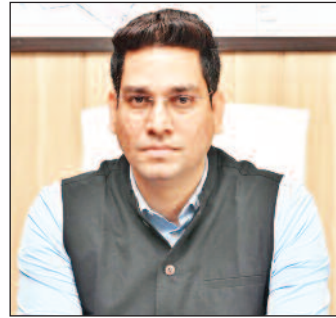
निगम कमिश्नर आदित्य डेचलवाल