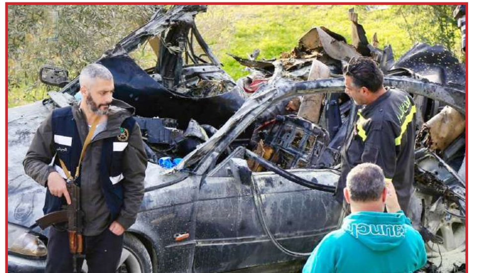
लेबनान में इजरायली ड्रोन हमले में क्षतिग्रस्त नजर आ रही एक कार। इसमें तीन लोगों की मौत हो गयी।

उन्होंने चेतावनी देते हुए कि पिछले साल मुझे सत्ता से हटाने के बाद से लगातार बांग्लादेश के हालात खराब होते जा रहे हैं। जिनका केवल बांग्लादेश की आंतरिक स्थिति पर ही नहीं बल्कि पड़ोसी देशों के साथ संबंधों पर भी व्यापक प्रभाव पड़ेगा। भारत भी इसमें प्रमुख रूप से शामिल है।